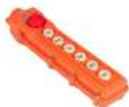
Controle Remoto com fio

O Mini Guindaste telescópico MGT 350 é ideal para montagem em veículos comerciais utilitários de pequeno porte por ser construído em aço de ultra resistência que conferem também Leveza, flexibilidade e rapidez na movimentação do equipamento.