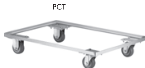
TODOS OS MODELOS DE CAIXAS

larg. x compr. (mm) Med. do Suporte : 390,0 x 585,0