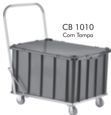
CB 1010 Com Tampa

Capacidade: 140 litros alt. x larg. x compr. (mm) Med. Ext.: 510,0 x 560,0 x 780,0 Med. Int.: 400,0 x 510,0 x 690,0