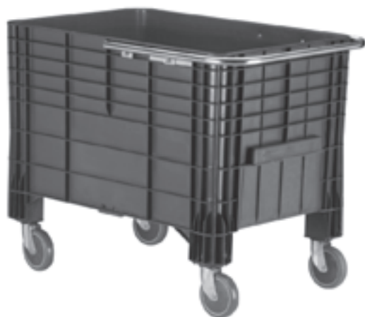
Roda Alta 6 Roda Baixa 4